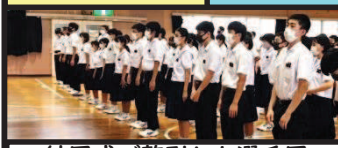
結団式で整列した選手団