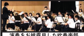
演奏をお披露目した吹奏楽部