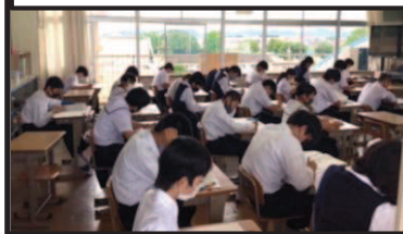
長崎県学力調査に真剣に取り組む2年生です。