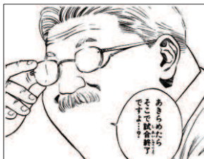
湘北バスケット部監督 安西光義 通称「安西先生」 「あきらめたら そこで試合終了ですよ…。」

選手のみなさん、「チーム郡」の輝きをしっかり 見せつけてきてください！ 思いを力に…。