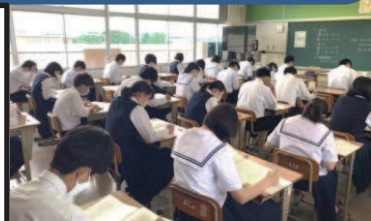
全国学力学習状況調査に真剣に取り組む3年生です。

今後とも、学校と家庭が連携して、生徒達の進路実現のための学力向上に取り組むことができたいと思っています。ご協力のほどよろしくをお願いします。