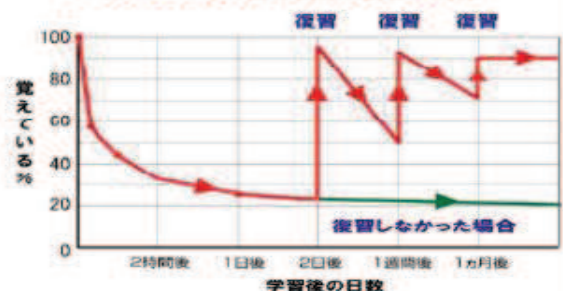
エビングハウスの忘却曲線と復習の関係