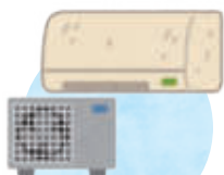
【エアコン及び室外機】

エアコン（室外機）・テレビ（薄型も含む）・冷蔵庫（冷凍庫）・洗濯機（衣類乾燥機）の4製品は、販売店が収集運搬しメーカーがリサイクルすることになっており、そのための費用は、消費者が負担することになっています。