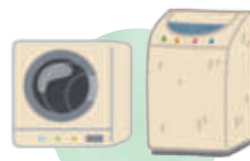
【衣類乾燥機・洗濯機】