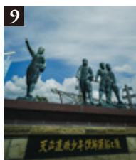
◆天正遣欧少年使節顕彰之像