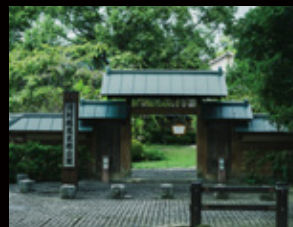
◆大村純忠終焉の居館跡