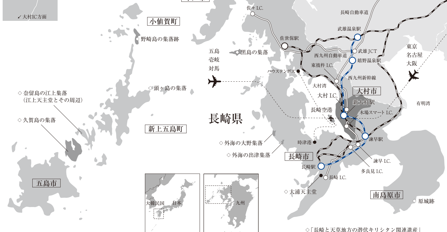
◇「長崎と天草地方の潜伏キリタン関連遺産」