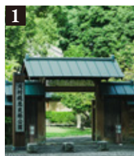
◆大村純忠終焉の居館跡