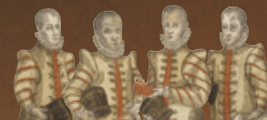
天正遣欧使節肖像画（京都大学附属図書館所蔵）