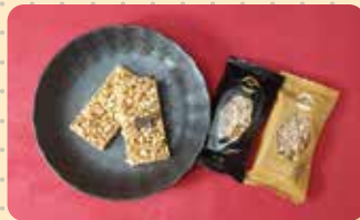
兵儿叶寿司米花糖