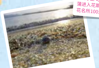
玻璃沙滩 位于通往长崎机场的大桥眼前的玻璃沙滩。色彩缤纷的玻璃沙组成沙滩，在阳光下照射下闪闪发光，作为网红拍照景点也很有名气。