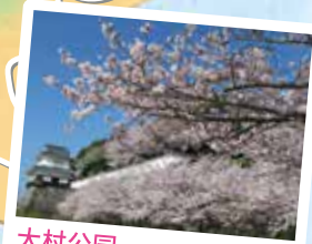
大村公园 大村公园每到春天会有21种、2000株左右的樱花渐次盛开，而到了5月下旬至6月上旬，约10万株、30万朵花菖蒲进入花期。此地也被选入了“日本樱花名所100选”。