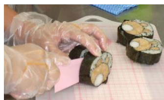
④巻いた寿司を食べやすい大きさにカットします。