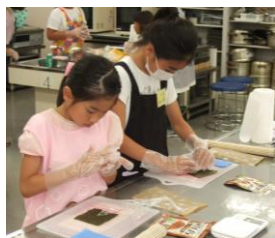
③耳、顔、口と細かな作業に集中しました。