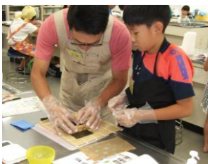
②ご飯を海苔で巻いて・・・お父さんが夢中?

この講座は、夏休みの一日、親子で料理する楽しさを体験してもらいたい、特に父親には日常的に料理に関わってもらうきっかけになればと企画しました。パパと参加してくれた親子も多く、内容は“クマさん”を巻きずしで作るということもあり、作業を分担しながら、親子で協力しあっている微笑ましい様子がたくさん見られました。