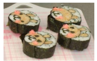
⑤最後に、目や口、ほほ紅をつけて完成です!