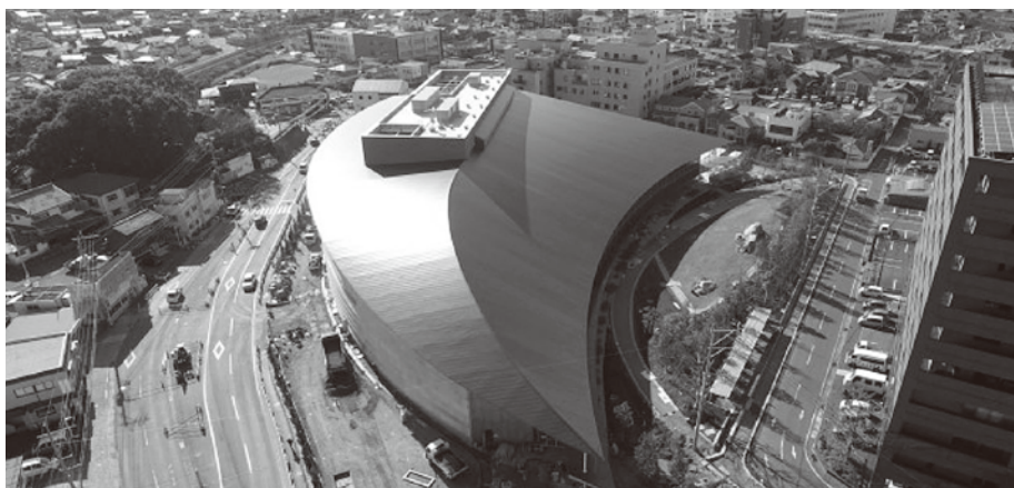
長崎県立・大村市立一体型図書館(愛称・ミライon図書館)と大村市歴史資料館は、本年10月5日に開館予定です。

工事請負契約の変更についてなど、3件の議決議案を可決しました。委員会での主な審査内容は、次のとおりです。