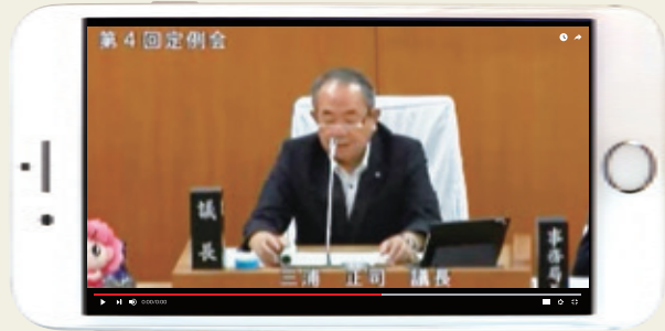
大村市議会ホームページ画面