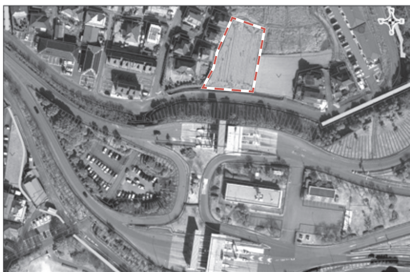
（池田2丁目大村インターチェンジ付近の写真です。点線の部分に駐車場が整備されます。）

▶ 平成30年度の補正予算や条例改正など、18議案を可決（同意）したほか、平成29年度の決算11会計を認定しました。