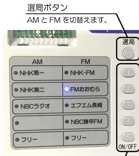
ON/OFF ボタン ボタンの左側に書いてある放送局に対応