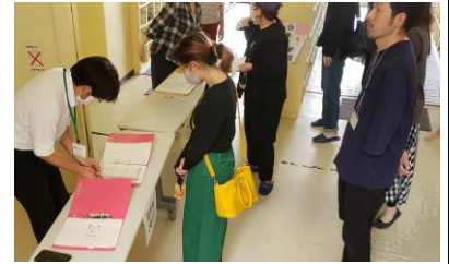
引き渡し訓練の様子

先週の月曜日に長崎県を含む九州北部地方は梅雨入りしたと発表がありました。平年より6日、去年より13日も早い梅雨入りだそうです。また、台風2号も日本列島の南を通過し、今後台風にも注意が必要な季節となってきました。