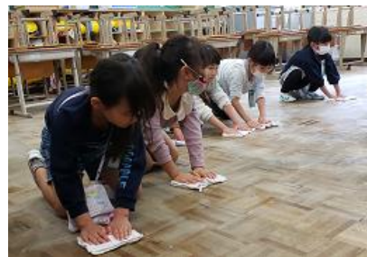
初めてのぞうきんがけ！

新学期が始まり一か月が過ぎました。子どもたちは新しい環境にも少しずつ慣れ、各教室からは明るく元気な声が聞こえてきます。1年生は、45分間の学習や給食、掃除、下校など、初めて尽くしの毎日でした。学校での約束事もたくさんあり、学ぶことを楽しみながら一つ一つ身に付けているところです。2年生以上は、進級した喜びを胸に今年度の目標に向かってやる気満々の様子が見えられます。子どもたちのやる気を大切に、充実した一年が過ごせるよう導いてまいります。