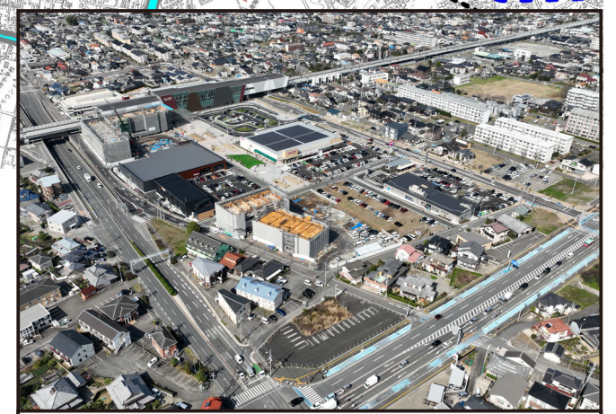
新大村駅前市有地開発事業(東口側)を望む_R6年3月撮影