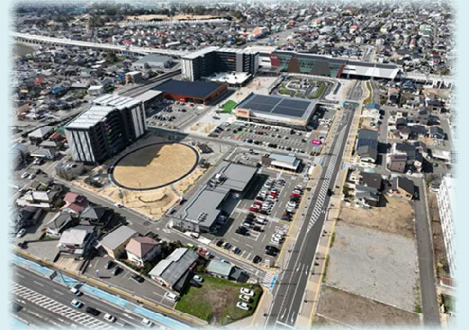
令和7年3月 新大村駅周辺

事業完了まで、もうしばらくとなりますが、引き続き、皆様方のご理解とご協力をよろしく願います。