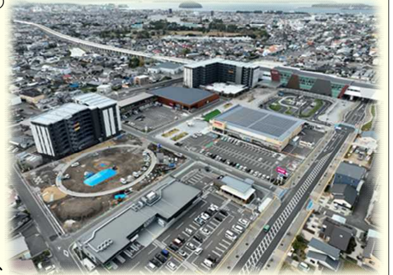
令和6年12月 新大村駅さくら口（東口）

改めまして令和7年度は、平成28年10月の事業計画決定から9年目を迎える年となりました。特に、年度内には、換地処分を予定しておりますので、引き続き、職員一丸となって取り組んで参ります。長期にわたる事業ではありますが、今後ともよろしく願いいたします。