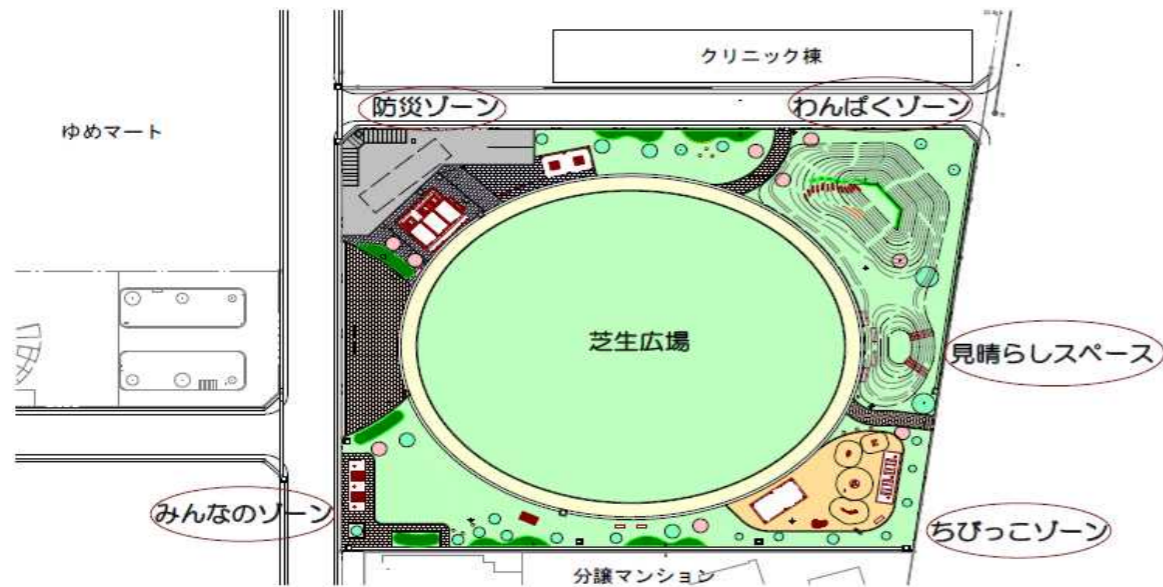
まちなか交流公園イメージ図

まちなか交流公園は、四季折々の植栽配置や幅広い年代が安全に利用できるゾーニングを行っており、散歩や休憩など日常的に利用したくなるような居心地の良い空間を感じることができます。また、災害発生時の一次避難場所や災害時の活動に対応できる防災設備を備え、安心安全な集いの場となるような、新しい大村らしさを持った公園です。