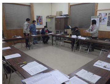
集積計画説明会の様子