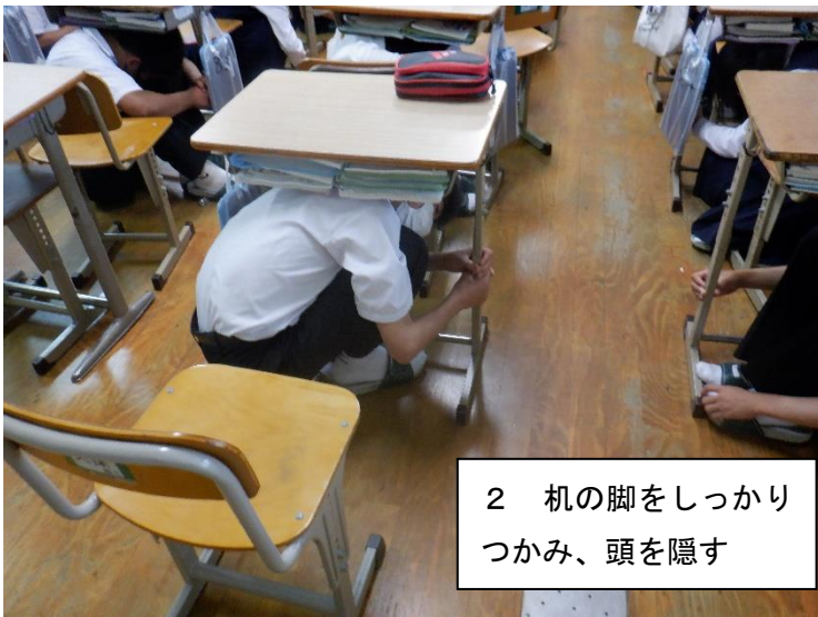
2 机の脚をしっかりとつかみ、頭を隠す