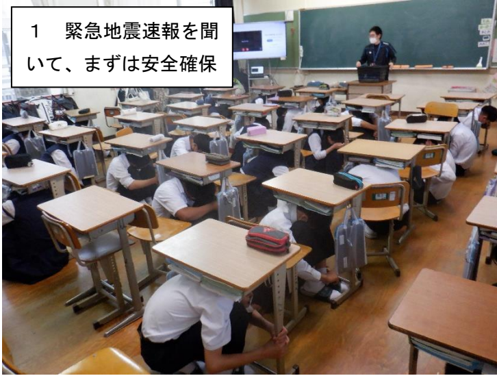
1 緊急地震速報を聞いて、まずは安全確保