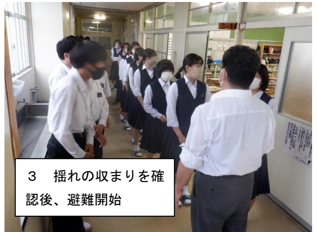
3 揺れの収まりを確認後、避難開始