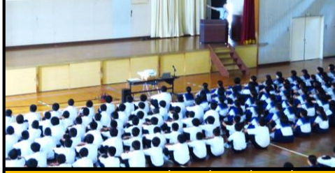
生徒の情報端末の所持数(人)