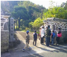
健全協ウォークラリー