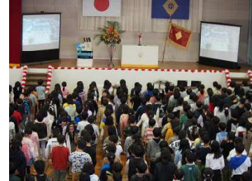
創立150周年記念式典