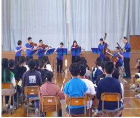
スクールコンサート(5年)