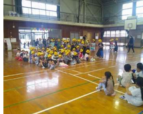
おもちゃ大会(1・2年)