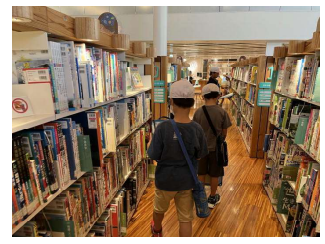
ミライオン見学(2年)