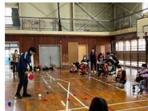
ポッチャ交流会(特支)