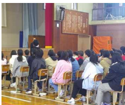
薬物乱用防止教室(6年)