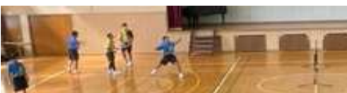
ソフトテニス部 男子