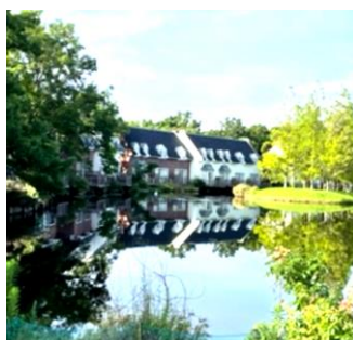
宿泊施設（フォレスト・ヴィラ）