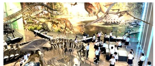
古代の神秘：恐竜博物館