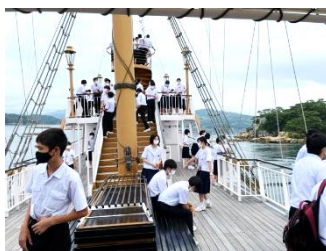
美しい九十九島遊覧

何よりも、生徒一人一人の目が輝いていました。様々な体験活動に挑戦し、本当に笑顔で楽しむ姿が印象に残っています。特に龍踊は満足度が高かったようです!!