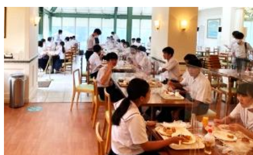
豪華な朝食バイキング