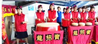
2時間半の講習で仕上げた迫力ある龍踊体験・発表会