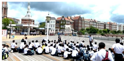
ワクワク・ドキドキ：ハウステンボス