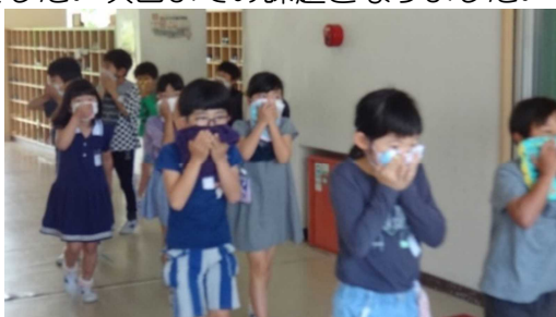
ハンカチを口にあて避難する2年生

17日に避難訓練を行いました。今回は今年度最初の避難訓練ということで、安全な避難経路を確認することを目的にしました。放送の合図で避難を開始した三浦っ子は、運動場に到着するまで真剣に取り組みました。一部喋り声があったのは残念でした。次回までの課題となりました。