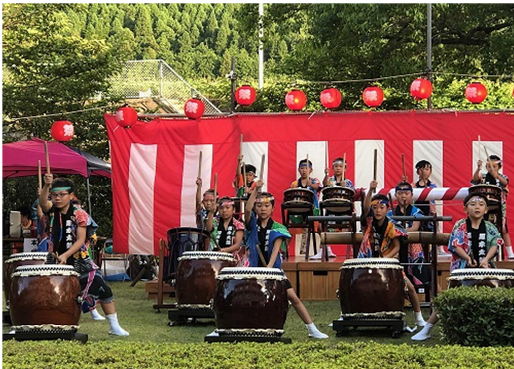
《黒木太鼓を地域で披露》

現在1～5年生の児童は、在籍する小学校へ、令和6年度新1年生は、大村市教育委員会へ申し込んでください。