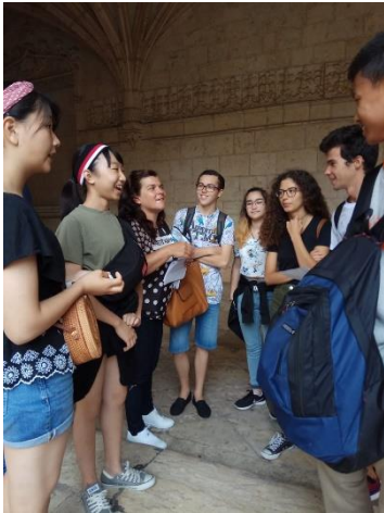
ジェロニモス修道院