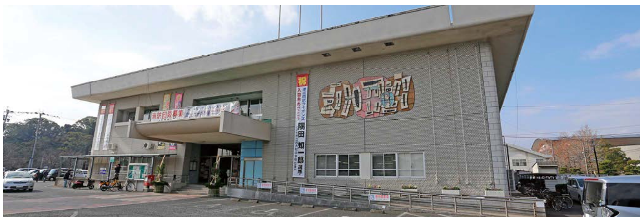
市役所本庁舎(昭和39年建設)

長崎県の中央部に位置する本市は、東に多良山系、西に大村湾を臨み、大村公園の国指定天然記念物オオムラザクラをはじめ、サクラヤハナショウブ、ヒガンバナなど、さまざまな花が季節を通して咲き誇る、自然豊かなまちです。 大村の歴史は古く、戦国時代、日本初のキリシタン大名大村純忠は、天正遣欧少年使節をローマに派遣し、幕末・維新の激動期には、大村藩が新政府側として活躍し、多くの人材を輩出しました。