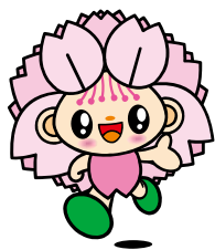
おむらんちゃん 平成24年2月誕生