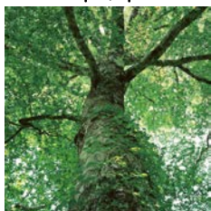
イチイガシ 平成元年指定