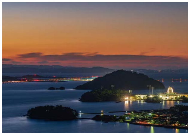
どん牛山(陰平町)からの夜景