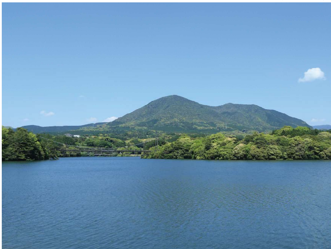
野岳湖公園と郡岳