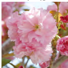
オオムラザクラ 昭和47年指定