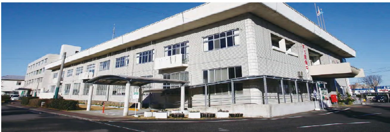
昭和39年に建設した市役所

長崎県の中央部に位置する大村市は、東に多良山系、西に大村湾を臨む自然豊かなまちです。 地域の面積は126.62平方キロメートルで、長崎空港と長崎自動車道大村インターチェンジを有する県内交通の要衝としての役割を担っています。 市制を施行した昭和17年当時の人口は39,572人でしたが、現在の人口は9万5千人を超えており、県央の中核的な都市として発展を続けています。