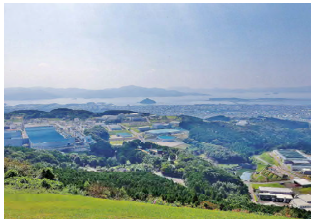
琴平岳からの眺め