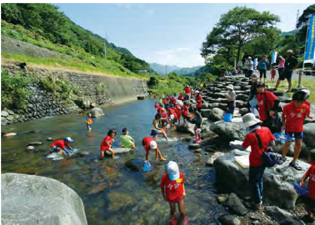
郡川で自然に親しむ