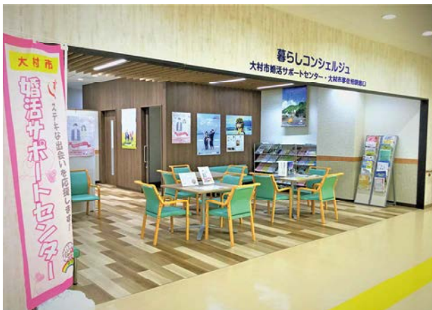
婚活サポートセンター(本町・プラットおおむら内)

保育園などへの入所にあたっては、こどもセンター内に保育コンシェルジュを配置し、相談対応を行っています。また、乳幼児から中学生までの子どもの医療費助成、母子・父子家庭などの福祉貸付金制度、低所得世帯の学用品費助成などに幅広く取り組んでいます。さらに、大村市婚活サポートセンターにおいて、結婚を望む独身者の出会いのサポートを行っています。これからも「子育てしやすいまちづくり」を目指して、切れ目のない支援に取り組んでいきます。