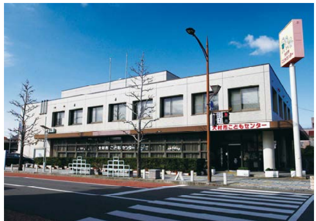
こどもセンター(本町)