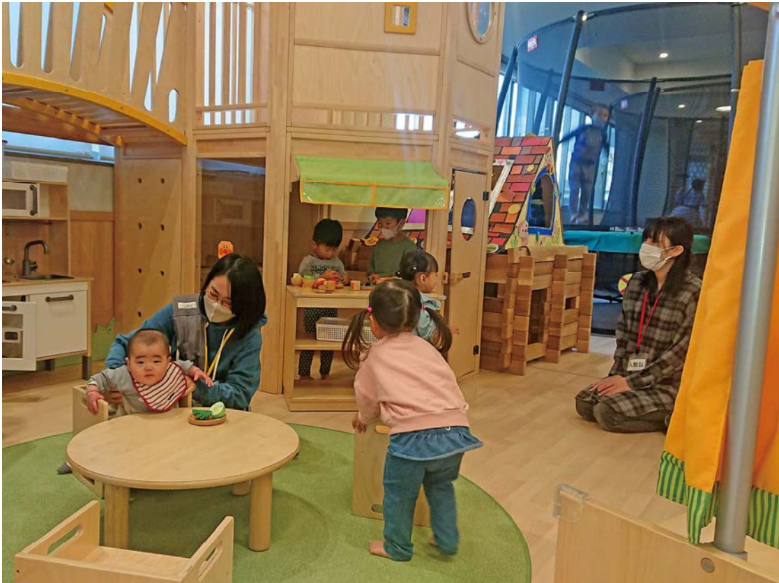
市内の地域子育て支援センター(本町・泉の里キッズルーム)