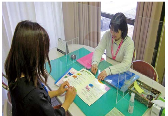
保育コンシェルジュ