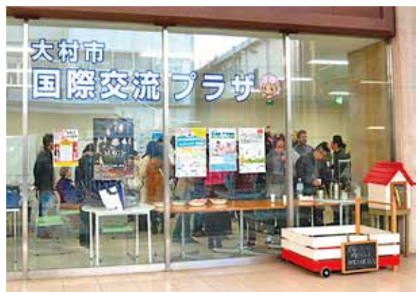
大村市国際交流プラザ(本町・プラットおおむら内)