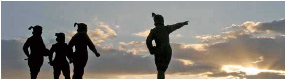
天正遣欧少年使節顕彰之像(森園公園)