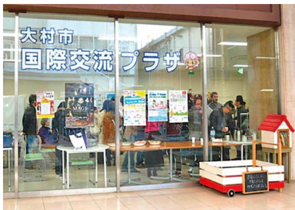
大村市国際交流プラザ(本町・プラットおおむら内)