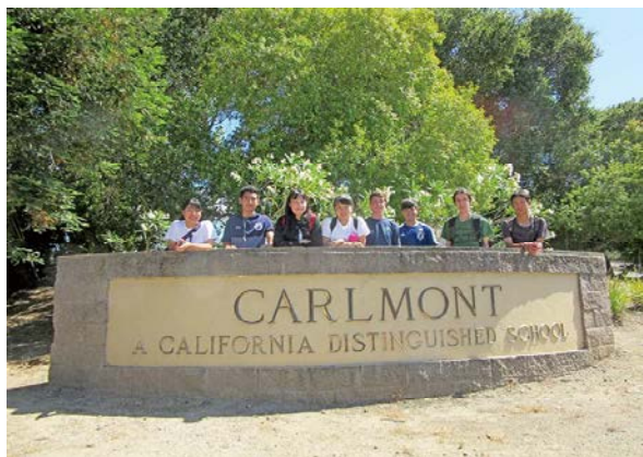
米国サンカルロス市へのホームステイ(2019年)

物産展などを開催し、交流を深めています。 仙北市:「花菖蒲まつり」で仙北市物産展 伊丹市:「いたみ緑化フェア」で大村市物産展 飯南町:「青少年交流ツアー」を相互に実施