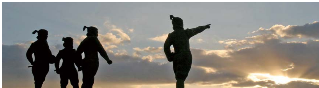
天正遣欧少年使節像(森園公園)