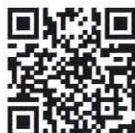
参加申込フォーム

イベントの様子をパネル展示 / 本事業の様子を写真パネルにして、 ミライON図書館にて展示予定です。