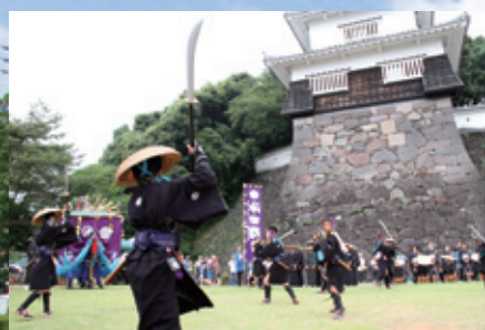
★国指定重要無形民俗文化財