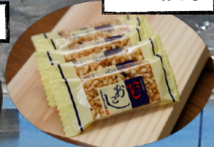
へこはずしおこし

シュガーロードにまつわる歴史のストーリー 「砂糖文化を広めた長崎街道 〜シュガーロード〜」 が令和2年に日本遺産に認定されました。