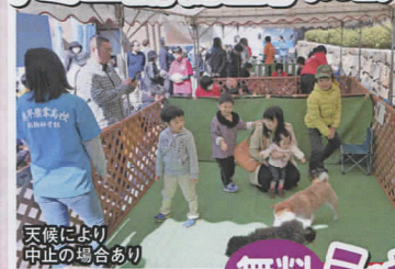
天候により 中止の場合あり