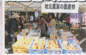
地元農家の農産物