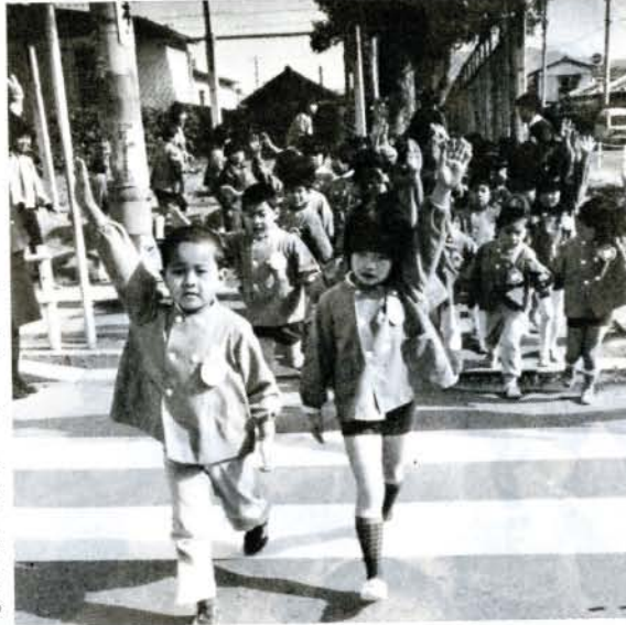
入学を前に「横断歩道の渡り方」を勉強する中央幼稚園のよい子たち

また同じ道でも、時間や、曜日によって交通事情が変わることも併せて教えておきましょう。●子供には「ああしてはいけない」「こうしてはいけない」といつても、あまり効きめはありません。安全な行動を具体的に