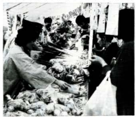
（にぎわう特産物即売会）

ので、記載上の注意事項をよく読んで必ず提出して下さい 資格を有する人 大村市農業委員会の区域に住所を有する人で次に該当する人 ①十アール（一反）以上の耕作の業務を営む人および同居の親族またはその配偶者で一年間におおむね六十日以上耕作の業務に従事する人（内縁関係の人は含まれません）