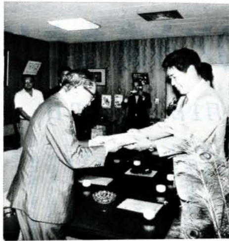
伊丹 J C