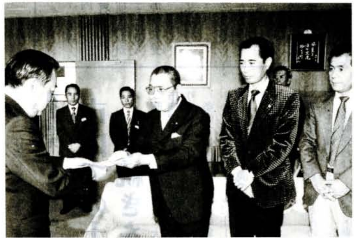
市長へ100万円を託すライオンズクラブの代表

なお、アフリカ難民救済についての申し込みなど詳しいことは福祉課社会係へお尋ねください。