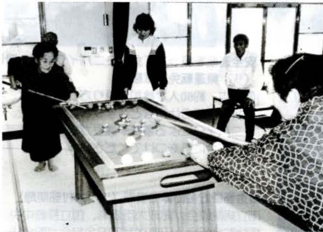
今日はビリヤードで楽しいひとときを過ごします

サンライフは、輝ける太陽のもとで、豊かな社会の一員として健康で快適な生活がでるホーム(生活の場)でありたいという願いのもとに、昭和58年8月開設されました。入居要件は ・60歳以上の健康な人 ・身寄りがない人、または家庭の事情で家族と同居のできない人 ・独立した日常生活のできる人 ・利用料その他必要な費用が納入できる人 ・となつていります。 きでりハビリコナーでは機能回復訓練も行われています。8月に夏まつり、11月は文化祭を開いて、地域の人たちとの交流を深めています。また、各種の自発的なクラブ活動も盛んに行われ、楽しいホーム作りを目指しています。