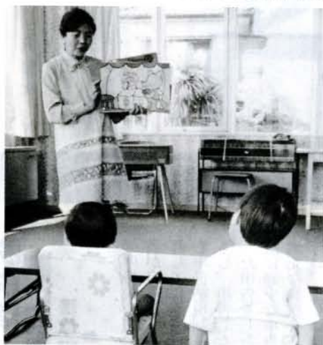
今日は楽しい「紙しばい」です。 どんなお話かな。