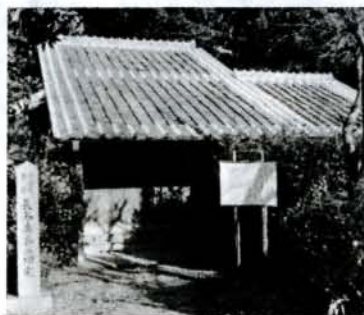
市文化財「長与専齊の旧宅」