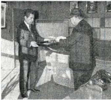
市長に目録を渡す山口・大村市農協長

声がかかっていました。鬼火のまわりでは、おとうさんやおかあさんたちの心づかいでうどんやせんざいのサービスもあ