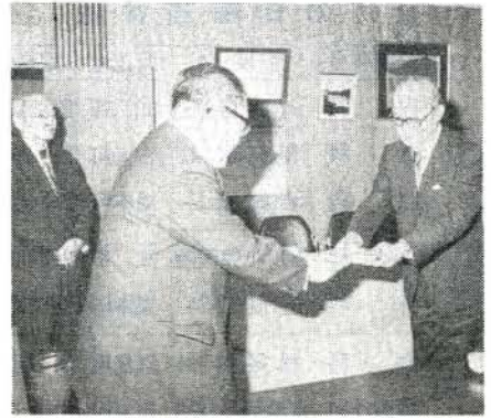
市長に目録を渡す安楽長崎放送取締役