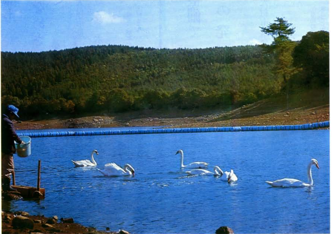
(伊丹市から贈られた白鳥：野岳湖で)