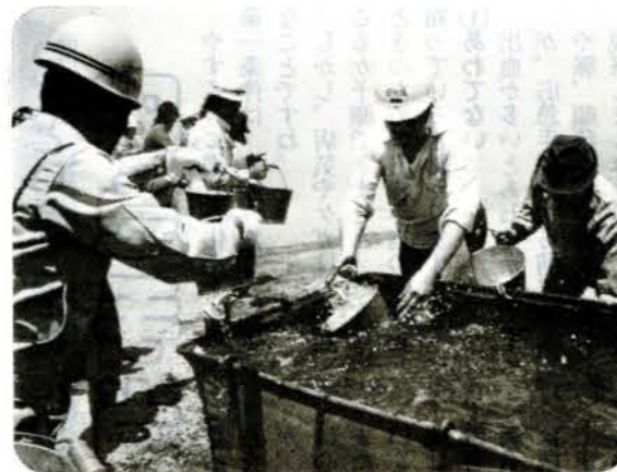
▲住民による初期消火「バケツリレー」