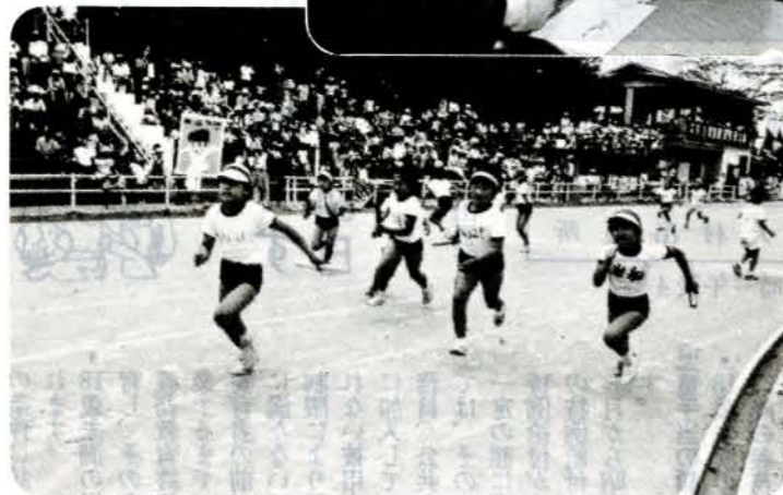
みんな一生懸命、頑張ったよ (%) 市営陸上競技場 第25回大村市子ども大会が開かれ、子ども会対抗リレーな どの競技に約3,000人が参加し、会場は一日中、歓声で沸きか えていました。