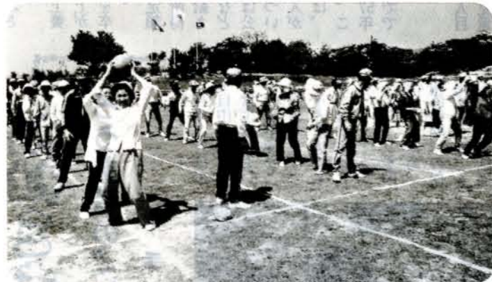
まだまだ元気です (%) 市営陸上競技場 第10回大村市老人クラブ連合会スポ ーツ大会に約2,000人が参加。元気な姿に、 美しい汗が光っていました。