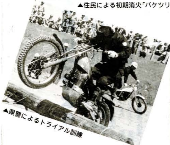
▲県警によるトライアル訓練