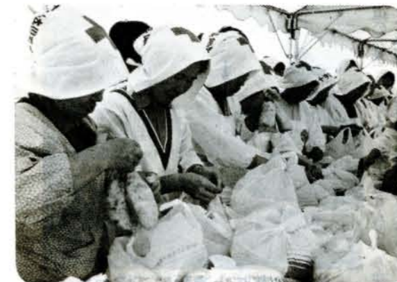
▲婦人会による非常食の配給準備

「梅雨前線の影響で、大村地方に大きな災害が発生した」との想定のもとに総合防災訓練が、県内より23団体約2,000人が参加して行われました。