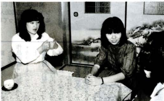
今日は家庭訪問、先生とお母さんのコミュニケーションに活躍

耳やこぼの不自由な人は、日常生活において大変不便なことがあります。そんな人たちの、社会生活におけるコミュニケーションを円滑にするため、関係機関への伝達や仲介などをするのが手話通訳奉仕員です。ろうあ者の申し出により市が奉仕員を派遣する制度ですが、最近では、病院や学校の家庭訪問、そのほか社会生活の多様なにもない奉仕員の仕事も多忙になっています。奉仕員の派遣を希望される人は、福祉課福祉係へご連絡ください。