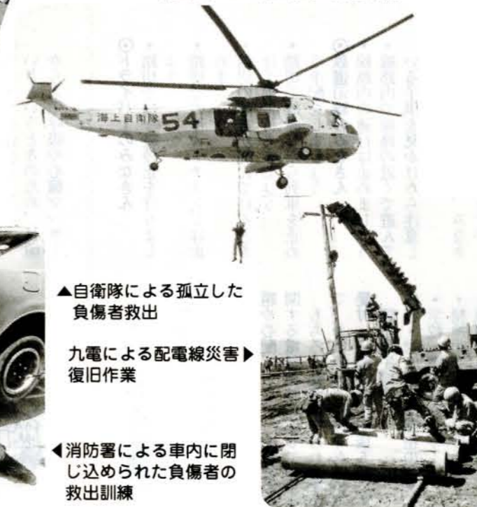
▲自衛隊による孤立した負傷者救出