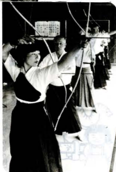
第3回大村市長杯争奪県下弓道大会 (%) 市弓道場 県内から40チーム、約140人が参加 し開かれ、団体の部で大村Dチーム が優勝しました。