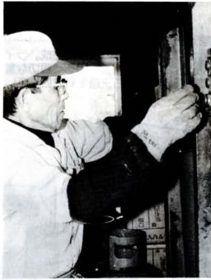
紹介所の世話で働く高齢者