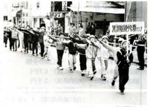
堂々の分列行進を行う少年消防クラブ

1月8日、消防団員、自衛消防隊、少年消防クラブなど約1000人が参加して行われました。