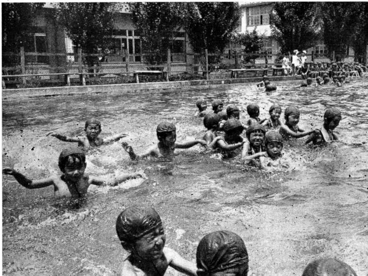
元気にはしゃぐ一年生 中央小学校プールにて

学校へいってらっしゃる子どもさんのあるご家庭では、もう夏休みのプランをお立てになっていることでしょう。子どもたちが学校から持ち帰ったお知らせとよくにらみ合わせて考えましょう。