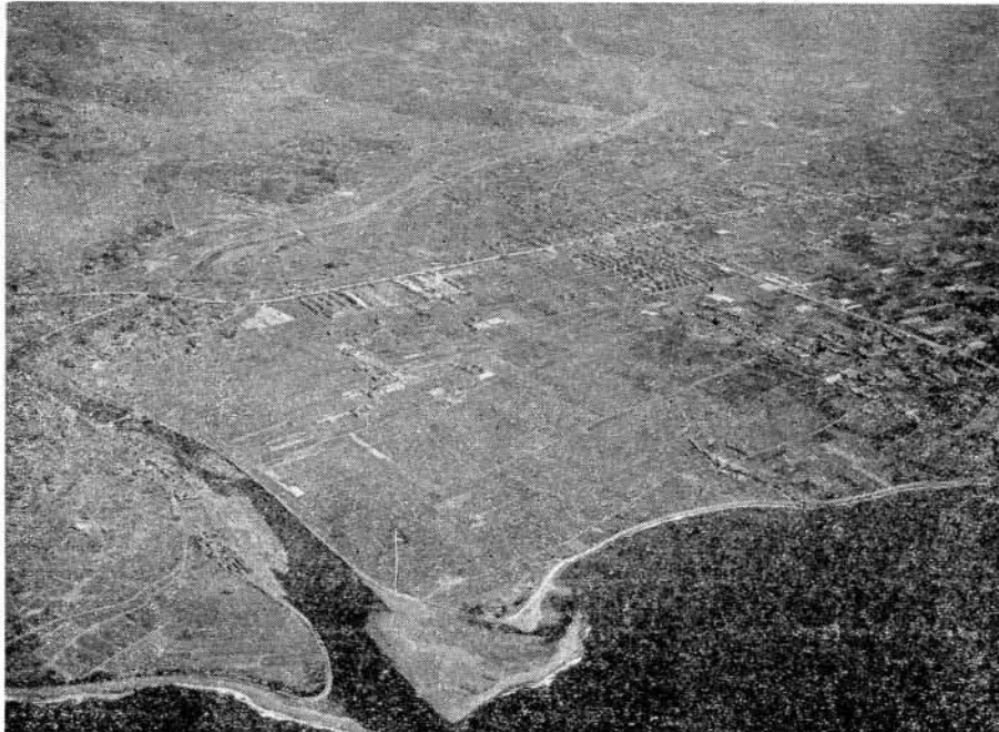
郡川周辺の肥よくな農土

興地域制度は今後とも農業の振興を図るべき地域をあきらかにしたうえで、農業上の利用計画、土地基盤の整備、農地保有の合理化及び農業近代化施設の整備を総合的な計画をたて、これを推進するということになっております。