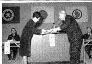
感謝状を受ける協力団体代表 市民会館にて