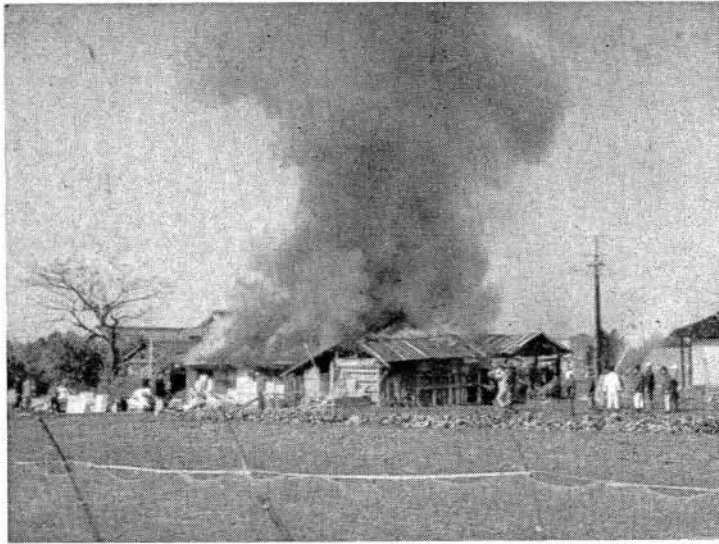
昭和45年1月18日 古賀島町火災現場より