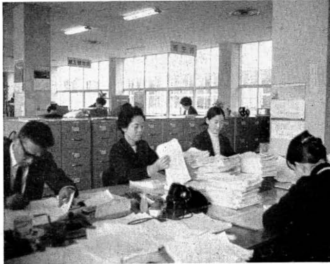
医療請求書の整理にいそがしい保険課の皆さん

いとき、または、旅行先で急病により病院や医院で治療を受けたときは、とりあえず治療費の全額を支払っていたら、後日その領収証と治療明細書を添え、保険年金課備え付けの療養費支給申請書に所定事項を記入のうえ、保険係へ提出してください。審査のうえ保険診療費の七割を支給いたします。