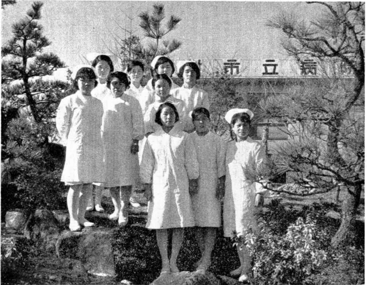
めでたく成人式を迎える白衣のおとめたち

おとなになったことを自覚してみずから生きぬこうとする青年を祝い励ます国民の祝日です。むかし武家の元服式が正月の十五日に行なわれた、そのしきたりにちなんだもので、女子も裳着とか髪あげなどの儀式が行なわれました。民法第三条に「満二十年ヲ以テ成年トス」と定められており法律上独立の社会人としての地位が与えられる